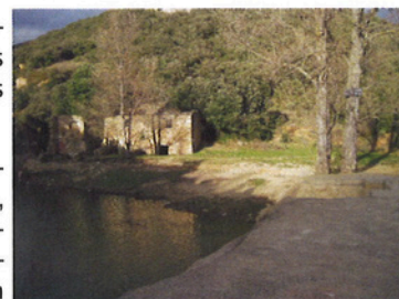
Vue du moulin de Ribaute depuis la rive droite du Verdoble

-Pour des crues fréquentes, le Verdoble peut déborder au niveau du moulin de Ribaute. Ce site, retenu comme point d'eau pour la défense des incendies, accueille de nombreux visiteurs notamment en période estivale (baignade). Le seul chemin d'accès peut être inondé par une crue du Verdoble et/ou du rec de Riben.